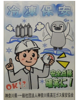
平成30年度入選作品

ア そのアートが主役になるような構成はなるべく避けてください。 イ 使用したアートをポスターに無条件で使用できることを確認し、ソフトメーカーからの許可回答の写しを添付してください。（無い場合は無効とする場合もあります。）